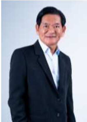
วันที่ดำรงตำแหน่ง: 8 พฤศจิกายน 2556 กรรมการ